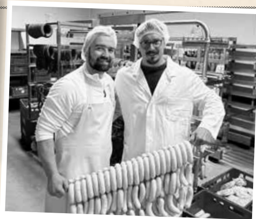
Metzgerei Lang Bad Birnbach (25 km) Fleisch- und Wurstwaren