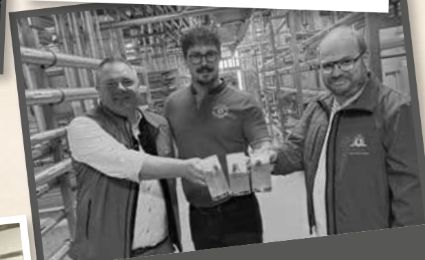
Brauerei Hutthurmer Hutthurm (34 km) Hof.Bier-Lieferant